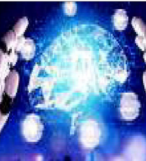
'এনট্রা ১৯৭৯ব' সৌরজগতের বাইরের গ্রহটির নামকরণ 'বিশাল আয়না' করেছে জ্যোতির্বিজ্ঞানীরা। ইয়োপিয়ান পেন্সে একোবির (হোল্ট) 'কারাবারিজেট অ্যাডভান্সড এনালিটিক্যাল' মিনন হ্যাট এই গ্রহের ওপর গবেষণার কাজ সম্পন্নিত করে। হোল্ট ও তথা আরিওয়ে। এক প্রতিবেদনের ব্যরতে এনট্রিটি

পৃথিবী থেকে ২৬৯ অশ্বকোষ মরুর একটি গ্রহ রয়েছে, যার নাম